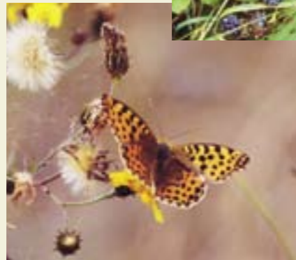
Pärlemorfjärilarna hör till våra vackraste fjärilar. Det finns flera arter och någon av dem kan ses flyga under hela sommaren